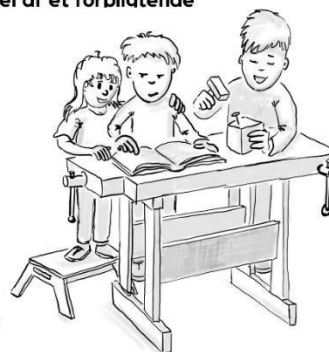
Illustration: Michael Eriksen, Visuel Retning 2018